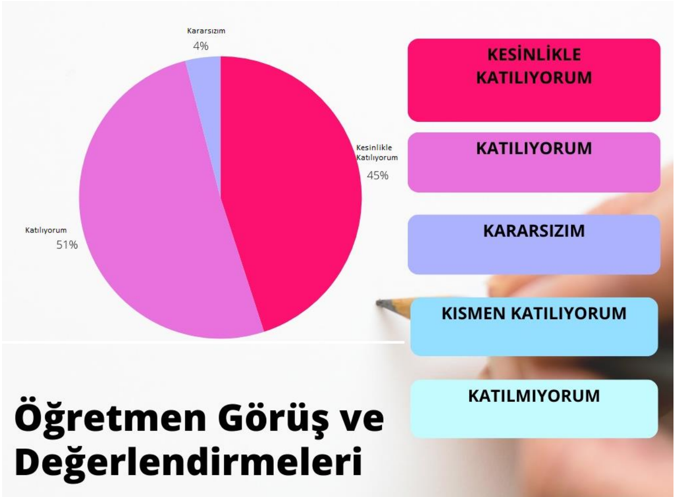
Şekil 1: Paydaşların Okul Faaliyetlerinden Memnuniyet Düzeyi

Asım Kocabıyık Anaokulu 12 öğretmen üzerinden; 17 maddelik anket düzenlenmiştir. Anket tam puanı 5 olup bunun üzerinden 5 puan Kesinlikle Katılıyorum, 4 puan Katılıyorum, 3 puan Kararsızım, 2 puan Kismen Katılıyorum, 1 puan Katılmıyorum sonucu çıkmıştır.