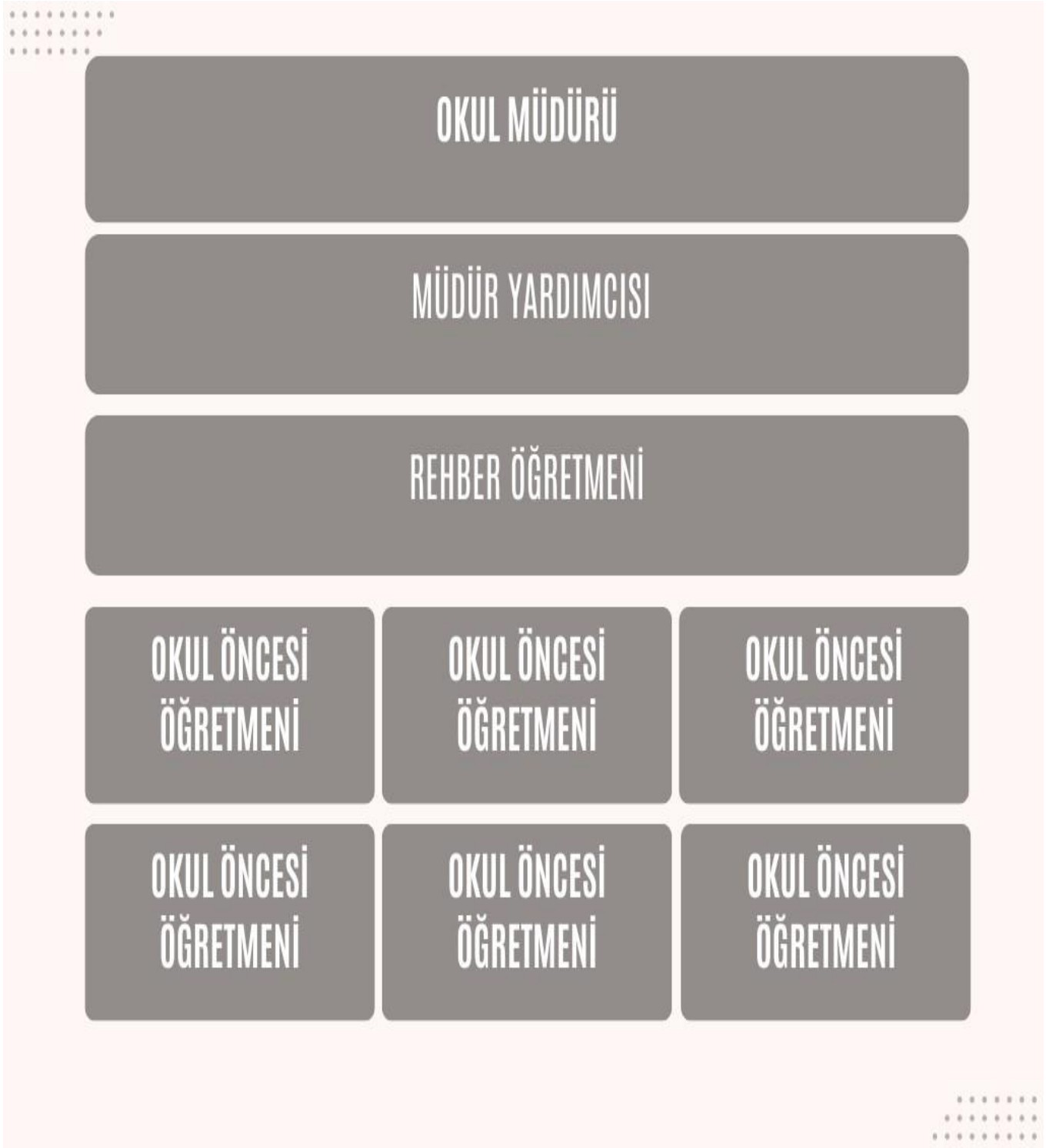
Tablo 6. Teşkilat Şeması